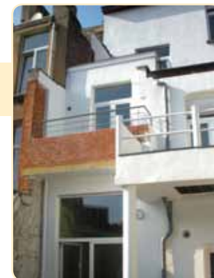
Gereneveerd huis in Laken met de hulp van het Betlehemfonds.

Het Betlehemfonds , erkend door de Koning Boudewijnstichting, ondersteunt het Betlehemproject en financiert initiatieven van sociale huisvesting. Dankzij uw giften ondersteunt het Betlehemfonds diverse renovatiedossiers met als doel die gebouwen ter beschikking te stellen voor sociale huisvesting.